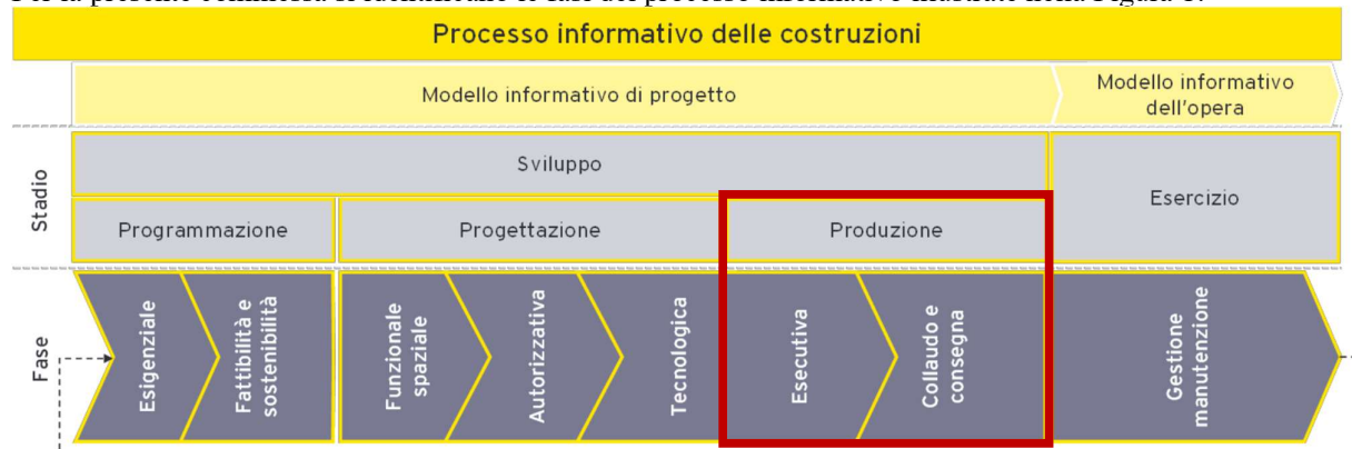
Figura 1 - Processo informativo delle costruzioni

Per la presente commessa si identificano le fasi del processo informativo illustrate nella Figura 1: