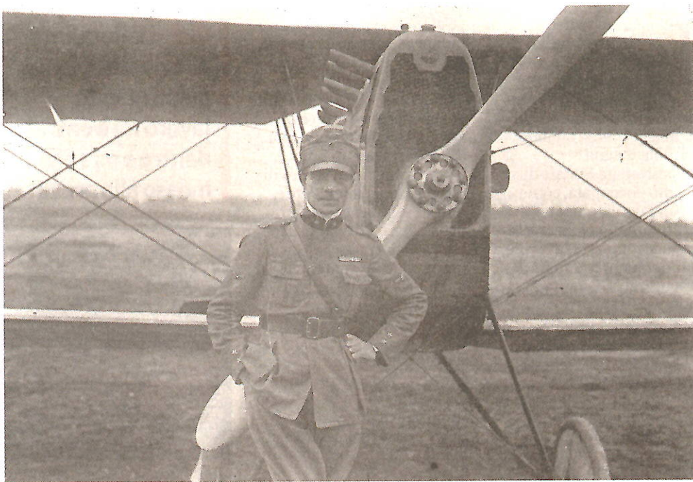
Arturo Ferrarin e il suo biplano Ansaldo SVA 9 a Centocelle nell'imminenza del decollo

PER SETTIMANE la stampa mondiale racconterà di Ferrarin e del raid italiano. Per la missione, in virtù della colla-