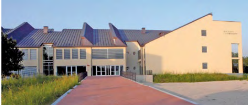
La nuova sede del Liceo "F. Corradini"

Con settembre, la sede del Liceo "F. Corradini" , Classico e Linguistico con gli uffici amministrativi, si trova nel nuovo complesso di via dei Tigli. Prende così forma la Cittadella degli Studi, un progetto qualificante per la Città e da tempo atteso, che ruota attorno al fulcro ideale della Biblioteca Civica. Il Liceo Scientifico resta per il momento dislocato nei due edifici di via Carlo del Prete, in attesa che venga rea-