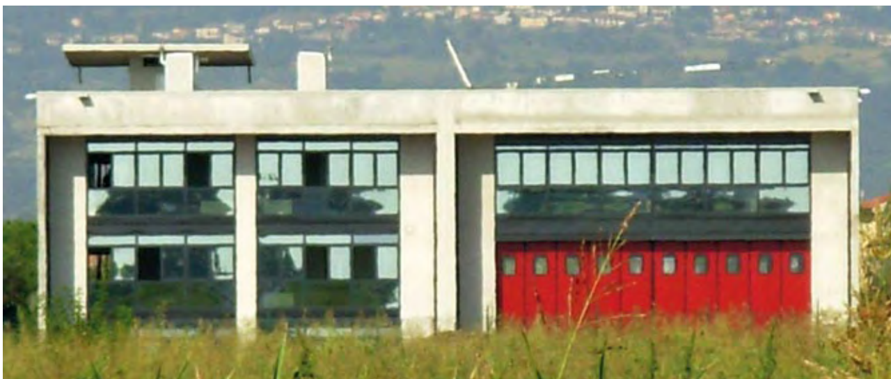
Il Centro Polifunzionale per le emergenze

A Thiene diventerà operativo a breve il nuovo Centro Polifunzionale per le emergenze, destinato ad ospitare Vigili del Fuoco, Protezione Civile e Radioamatori. Un punto di riferimento importante per la città.