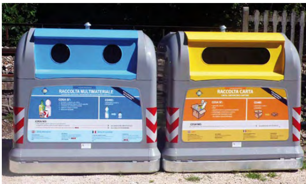
I nuovi cassonetti della città di Thiene