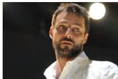
Alessandro Preziosi è "Cyrano de Bergerac" in cartellone per il 27, 28 e 29 marzo

Tutti gli spettacoli della XXXII Stagione di Prosa sono pubblicati nella sezione APPUNTAMENTI IN CITTÀ