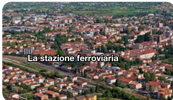
La stazione ferroviaria

La porta di accesso per facilitare l'afflusso di utenza dal territorio è la Stazione ferroviaria che rappresenta per dimensioni e potenzialità una opportunità unica per sviluppare un sistema di interscambio tra mobilità su binario e mobilità su gomma.