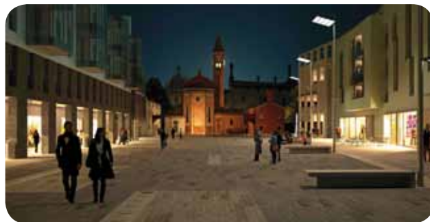
Rendering "Nova Thiene by night".

Il palazzo comunale, il Castello, le chiese, il teatro e la cortina di edifici di corso Garibaldi contribuiscono ad arricchire il patrimonio edilizio del nucleo storico di Thiene.