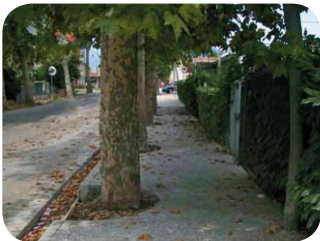
I recenti lavori in via Marconi

Ci sono numerosi progetti pronti e già finanziati per quanto riguarda la sistemazione delle strade: via dei Quartieri parte nord, via F.lli Brusaterra, via Caneo, per 235mila euro di spesa, per un intervento di asfaltatura con messa in sicurezza della pista ciclabile di via S. Gaetano (con posa transenne di protezione); via Dante, via Bellini, via Vianelle, via De Lellis, via Kennedy, investimento complessivo di 230mila euro, per interventi di asfaltature che rispondono ad una precisa esigenza della città; via Economia, via Granezza, via Cà Magre e via Braglio, nel tratto più dissestato, lavori di asfaltature per 280mila euro; via dell’Industria, investimento importante di 670mila euro, per un rifacimento totale della strada: Avs, Alto Vicentino Servizi, sta rifacendo la fognatura, poi si dovrebbe procedere con i lavori dell’Amministrazione Comunale, che prevedono anche sottoservizi, illuminazione e a fianco pista ciclabile sul modello di via del Lavoro; la pista ciclabile da via S. Giovanni Bosco a via Ungheria, 580mila euro di spesa, per un nuovo tratto che consente di collegare il sottopasso di Rozzampia, dalla parte sud della città quindi, alla zona