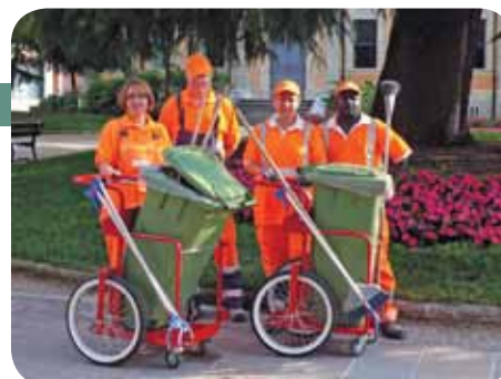
Il team del progetto di decoro cittadino e manutenzione del verde