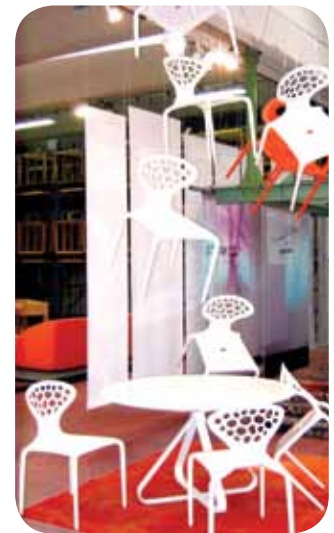
Il nodo EXPO

Agli appuntamenti del calendario thienese si aggiungono poi "Viridalia" nella cornice del Castello, le rinnovate "Rievocazione Storica" e "Mercato Rinascimentale" (biennale) e la novità "Palio delle Contrade", evento di successo anche grazie al contributo dei Comitati di Quartiere.