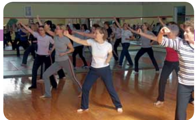
Corso di autodifesa femminile

In tutto nove corsi di autodifesa femminile dal 2009 frequentati da 353 iscritte, un corso sull'autostima, diversi convegni ed iniziative di sensibilizzazione sulla violenza domestica, l'istituzione, in collaborazione con la parrocchia del Duomo, nell'ottobre 2008 della Casa della Solidarietà, che ha accolto 12 donne e 7 minori e l'avvio del Centro Ascolto Donna, con personale qualificato a disposizione per due ore settimanali e a cui si sono rivolte dal marzo 2010 circa 50 donne. Una serie di iniziative che si è aggiunta all'attività ordinaria, che prevede anche le graduatorie per le case popolari. Circa 7/8 gli appartamenti di Edilizia Residenziale Pubblica assegnati annualmente nell'ambito del fisiologico ricambio, con un picco di 45 assegnazioni nel 2008, quando si sono resi disponibili anche i nuovi alloggi di via S. Ilario. Una mano data a chi è solo o in difficoltà che a Natale diventa anche un invito a condividere il pranzo o a visitare bambini ricoverati, grazie alla solidarietà di benefattori privati. Un gesto in più, semplice, ma ricco di umanità.