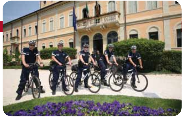
Vigili di Quartiere