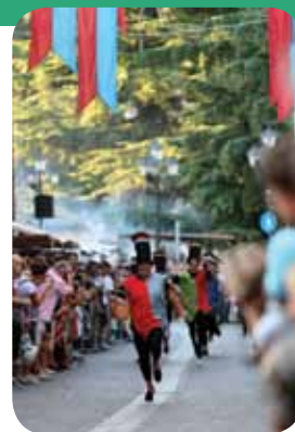
Il Palio delle Contrade

Oltre alla programmazione di numerose manifestazioni, l'attività ha svolto un'efficace strategia di promozione del territorio per svilupparne l'attività turistica. Da questo punto di vista, un ruolo fondamentale è quello di Pedemontana. Vi Turismo. Nata nel 2003, ha dato voce e coordinamento a quanto di meglio e di importante può offrire l'area pedemontana vicentina,