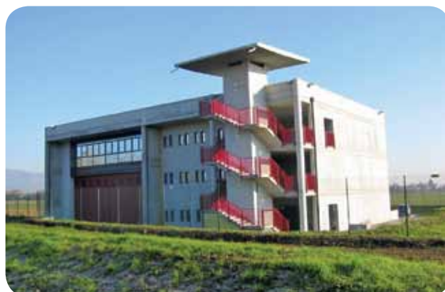
Il Centro Polifunzionale

2010 - Tra gli interventi principali: il Centro polifunzionale Vigili del Fuoco, Radioamatori, Protezione Civile, investimento di 1 milione 450mila euro, e l'asilo nido Aquilone, 1 milione 415mila euro. Interventi per la riqualificazione di piazza Rovereto 366mila euro, la manutenzione della caserma dei Carabinieri 242mila 600 euro, il percorso pedonale di via Cà Orecchiona 215mila euro, rifacimento marciapiedi 3° Z.i.a. e park Santo 275mila euro, manutenzione di via Vittorio Veneto Ponte di Ferro 160mila euro, manutenzione via Lampertico circa 41mila euro, parcheggio ex Scalo Merci alla stazione ferroviaria 42mila 300 euro, nuova sala convegni di via 1° Maggio intitolata successivamente al capitano Matteo Miotto 120mila euro, linea interrata pubblica illuminazione via Trifogli 24mila euro, ristrutturazione Tomba Mazzini al cimitero 25mila euro, impianto sonoro corso Garibaldi oltre 32mila euro, impianto semaforico mobile (Consorzio Polizia Locale) 96mila euro, impianto videosorveglianza (Consorzio Polizia Locale) oltre 62mila euro, impianto semaforico pedonale di via Marconi circa 17mila euro.