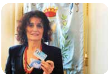
La prima carta d'identità elettronica del Comune di Thiene

La prima carta d'identità elettronica del Comune di Thiene e l'introduzione del nuovo servizio di prenotazione di appuntamenti via web Salta la fila! Entra in Rete .