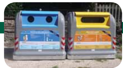
I nuovi cassonetti

Si è anche attuato un progetto che sta dando buoni frutti e riguarda la riduzione della capacità riproduttiva dei piccioni attraverso il mais sterilizzante. Non si è ancora in grado di quantificare gli effetti perché il progetto ha un anno di vita, ma la sensazione diffusa è che il numero di piccioni in città sia diminuito.